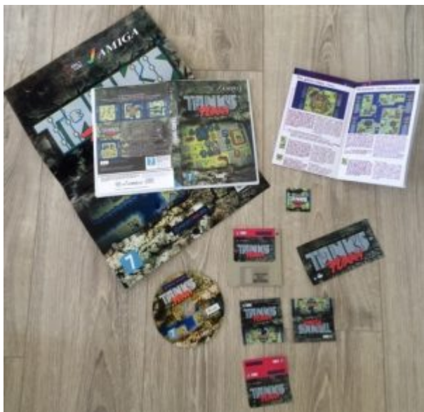
Mein Exemplar von Tanks Furry

Denn neben dem Spiel auf CD erhaltet ihr noch ein Poster, Türmagnet, Sticker und Disklabels sowie ein gedrucktes farbiges Booklet zum Spiel dazu. Die Diskette ist ebenfalls für nur 1€ zusätzlich mit bestellbar.